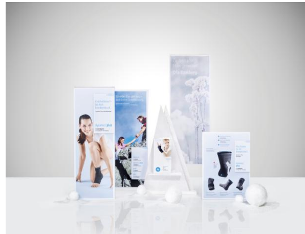
Ofa_Image_35-04: Dynamics Plus-Dekoration in kühlen Farbtönen für den Winter.