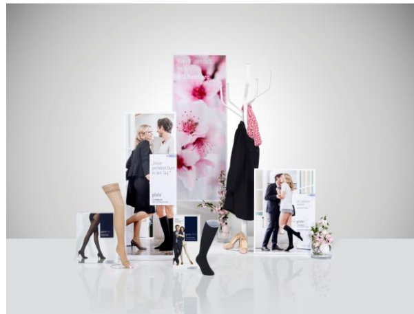
Ofa_Image_35-02: Frühlingshafte Gilofa-Dekorationsvariante zeigt stilbewusste, junge Geschäftsleute.

[Bilder zur freien Verwendung bitte mit Urhebervermerk Ofa Bamberg]