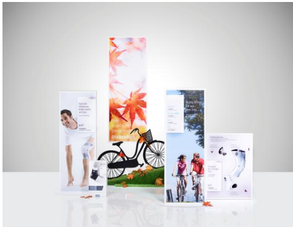
Ofa_Image_35-03: Aktivierende, spätsommerliche Dekoration für die Push care Kniebandage.