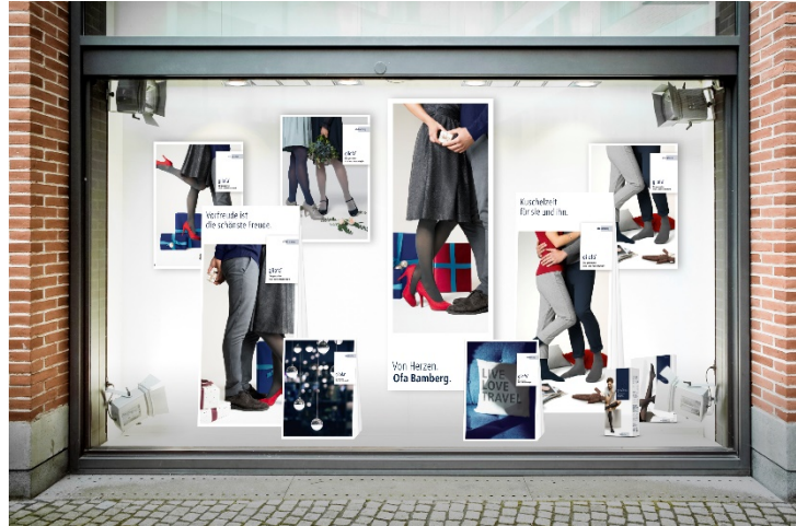
Ofa_Image_30-3: Festliche Stimmung und eine gemütliche Atmosphäre strahlt die Herbst-/Winterdekoration von Gilofa aus.

Das neue Dekorationspaket von Gilofa rückt festliche Momente in den Mittelpunkt. Auch hier haben die Displays unterschiedliche Höhen, um die Werbeflächen optimal zu gruppieren. Die festliche Bildsprache der Motive auf Displays und Postern legt nahe, selbstverpackte Geschenke im Schaufenster zu platzieren. Dafür eignen sich unterschiedlich große Kartons, die mit ähnlichem Geschenkpapier verpackt sind. Passend dazu: Weihnachtskugeln, die von der Decke in unterschiedlichen Höhen herabhängen.