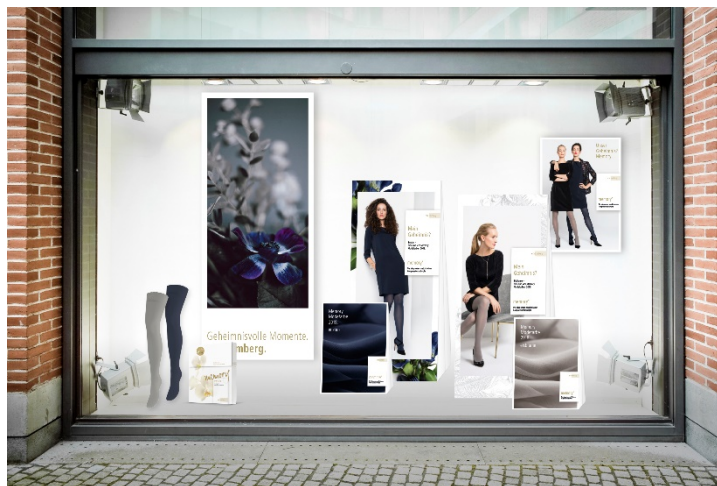
Ofa_Image_30-1: Das Dekorationspaket von Memory setzt die Modefarben Eisblume und Enzian gekonnt in Szene.

Im Mittelpunkt der Memory Dekoration stehen die beiden herbstlichen Modefarben Eisblume und Enzian. Sie werden auf rund 140 cm hohen Displays elegant in Szene gesetzt. Kleinere Aufsteller mit einer Höhe von 65 cm verleihen dem Schaufenster zusätzlich Tiefe. Eine Fahne, ein Poster und Dekostrümpfe vervollständigen das Bild.