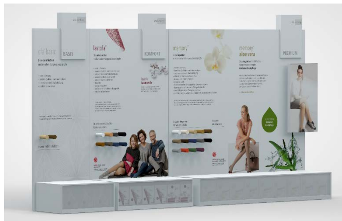
Ofa_Image_15-1: Auf 4,5 Metern zeigt die Ofa Verkaufswand eindrücklich die Vorteile von höherwertigen Kompressionsstrümpfen.

Im linken und damit auch kleinsten Bereich ist das Basissegment platziert. So weiß der Endkunde schnell, welches Produkt er zuzahlungsfrei erhält. Daran schließt sich der Komfortbereich Lastofa und Lastofa Baumwolle an. Statt der zwei Basis-Farben stehen dem Endkunden hier bis zu acht verschiedene Farbtöne zur Auswahl. So erkennt der Kunde schnell einen der Vorteile höherwertiger Kompressionsstrümpfe. Im rechten Bereich, der die Hälfte der Wand einnimmt, befinden sich die Informationen zu Memory und Memory Aloe Vera – den Premiummarken von Ofa Bamberg. Durch die großzügige Darstellung können die Produkthighlights und die Vielfalt an Farben optisch ansprechend präsentiert und das Interesse für die Premium-